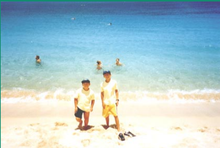
7。 Sunset beach