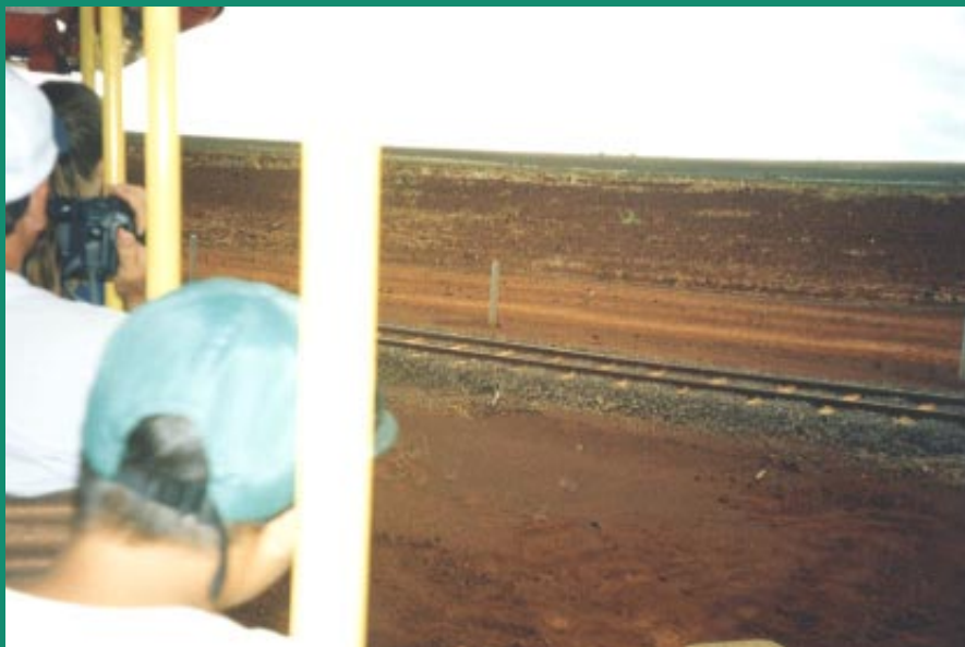
1 6。 Dole plantation farm train