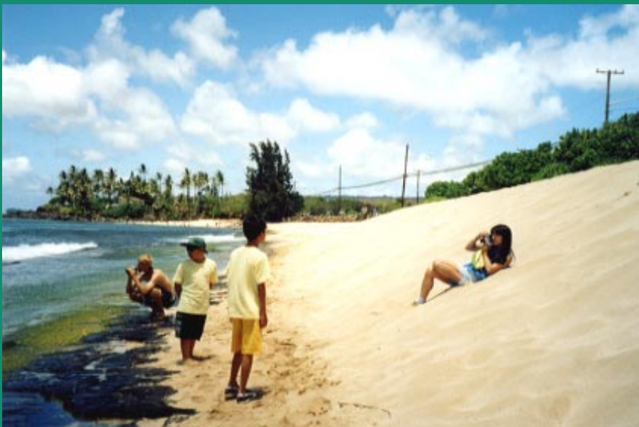
10。 Kawaiiloa beach