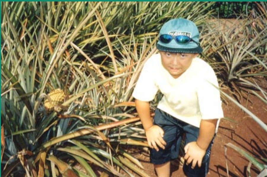
1 3。Dole plantation farm