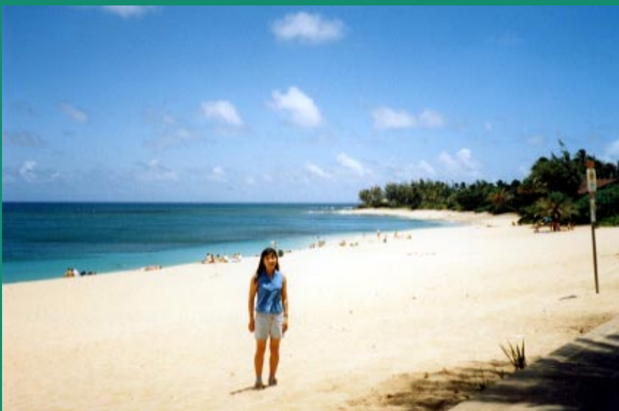
5. Sunset beach