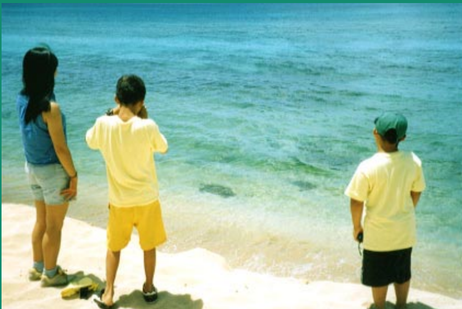
11。 Kawaiiloa beach