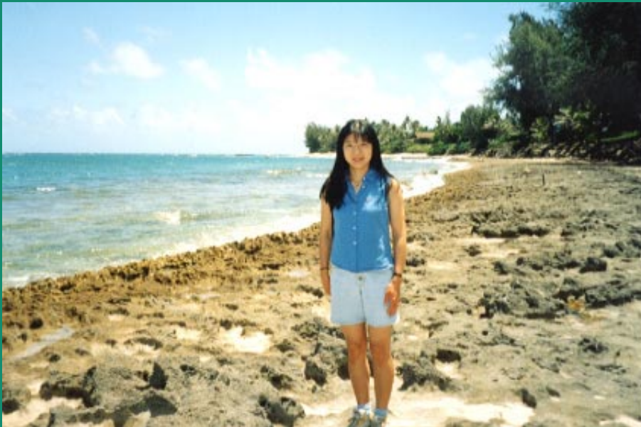
4. Ponders beach