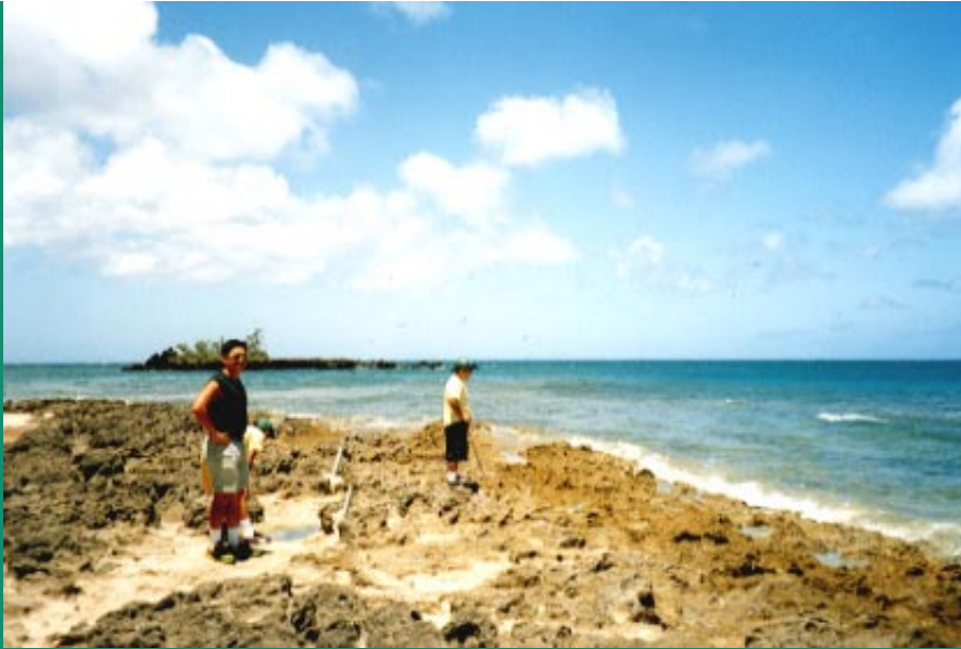
3. Ponders beach