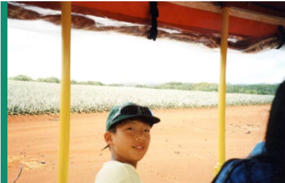
1 5。 Dole plantation farm train