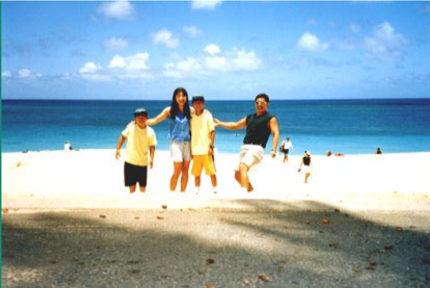
6。 Sunset beach